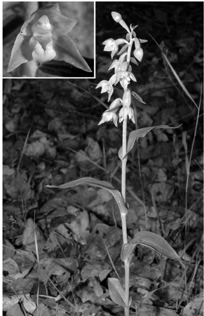
Figura 1. Epipactis fageticola , dins d'una albereda a la vora del riu Montsant (12-VI-2011). El requadre mostra els detalls de la flor.

Tàxon del complex d' E. phyllanthes conegut de diversos indrets del centre i nord de la Península Ibèrica. Tot i que va ser inicialment considerat com a propi de fagedes, sembla que és més comú en boscos riparis (Gamarrà et al. , 2014; Crespo, 2005). A Catalunya, s'ha citat en boscos caducifolis humits de la Garrotxa, el Ripollès, l'Alt Empordà i Osona (Oliver et al. , 2009). A les Terceres Jornades de Prospecció Biològica de Catalunya (2016) s'ha indicat també al la Conca de l'Abella, quadrat DG3667 (Font, 2017). La localitat descrita aquí, per tant, és la primera per al sud de Catalunya. Vessant sud: Riu Montsant, a l'interior d'una vella albereda (184 m), unes desenes d'individus en flor (Fig. 1), 12-VI-2011,