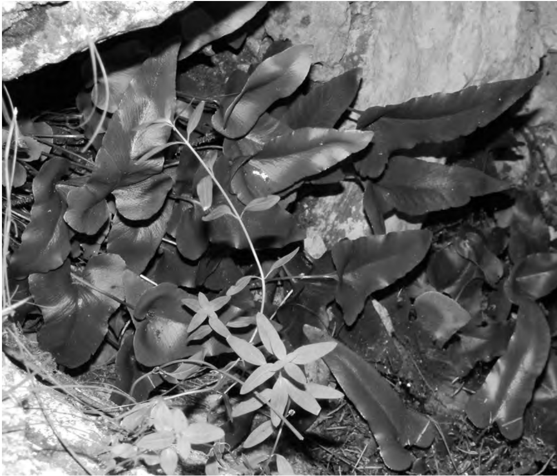
Figura 5. Phyllitis sagittata , a l'entrada de l'avenc de Cantacorbs (11-X-2014).

cat per Montserrat Domingo, ermitana de Sant Joan: aquesta localitat és l'única coneguda per al territori catalanídic central.