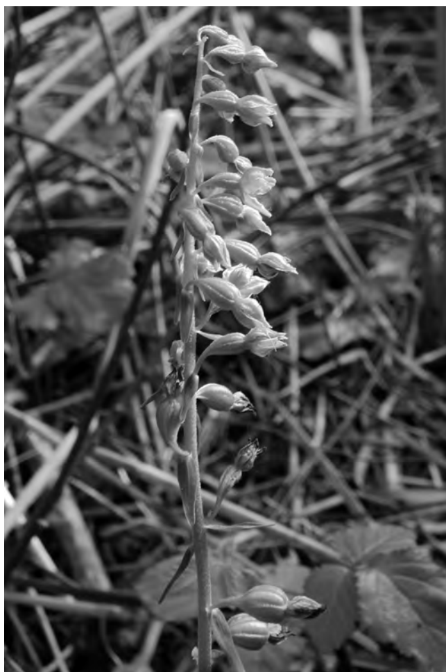
Figura 2. Epipactis rhodanensis , en un codolar al marge d'una albereda, a la vora del riu Montsant (19-VI-2016).

ra localitat per al territori catalanídic central. Probablement una exploració més acurada dels boscos riparis a l'època adequada permetrà trobar noves localitats de les orquídies pertanyents a E. gr. phyllanthes .