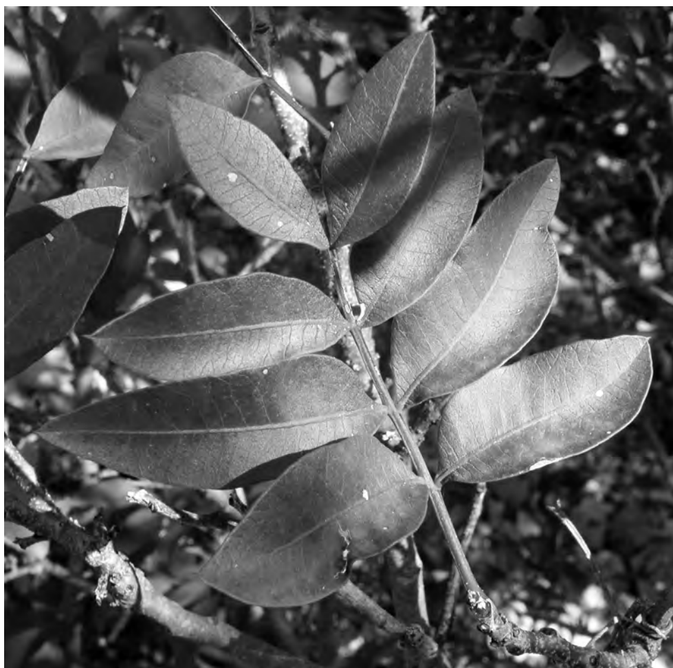
Figura 4. Pistacia x saportae , detall de la fulla marcescent. Base del cingle dels Montalts (12-XII-2012).

tingir-la del pi carrasser autòcton ( P. nigra subsp. salzmannii (Dunal) Franco) en les primeres fases de desenvolupament. Vessant sud: Pla del mas de Forçans (585 m), 11-VII-2010, CF1469; Fondalades i vessants entre el mas de Forçans i el mas Blanc, a prop del camí dels Cartoixans (580-650 m), 11-VII-2010, CF1469. Montsant occidental: Voltants del Mas Déu, cap al coll de la Guixera (610 m), 17-IX-2011, CF1368; Collet del Pla del Bisbe i vessant oriental de la punta de la Canaleta (630-660 m), 17-IX-2011, CF1368.